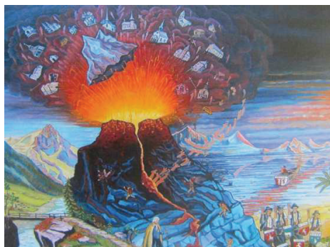
Une des œuvres accrochées à la Tour: la fusion des communes d'Anniviers.