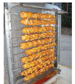
Voici l'un des trois nouveaux grils électriques hypermodernes. Qualité et rapidité garanties. Les files d'attente, c'est fini.

Ce rassemblement populaire de la mi-été est très apprécié des